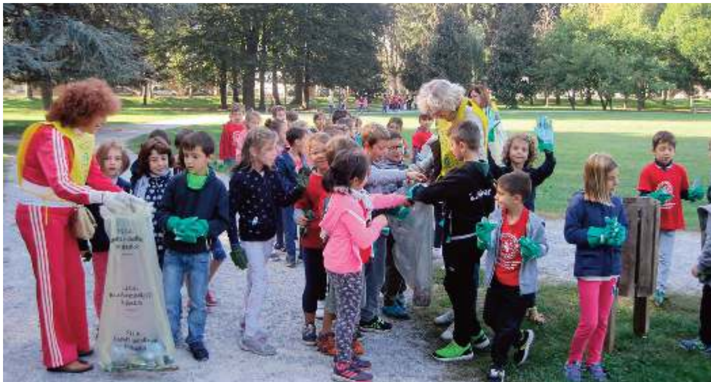
L'iniziativa "Puliamo il mondo" (qui l'edizione 2018) viene organizzata a livello internazionale col nome di "Clean up the world"

Contrasto all'abbandono dei rifiuti e promozione del riuso: a Savigliano la sostenibilità ambientale è di casa come dimostrano gli appuntamenti in programma venerdì 27 settembre: "Puliamo il Mondo" ed un'iniziativa sul riuso nell'ambito del progetto "In.Te.Se."